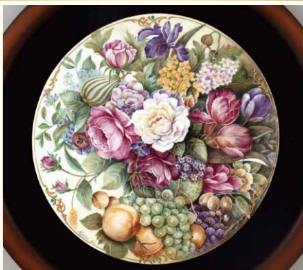
プレミアムデコラティブペインティング