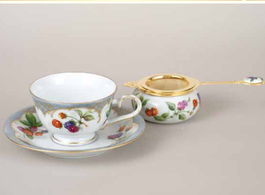
ヨーロッパンチャイナペインティング