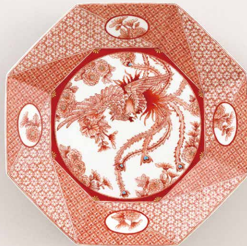
九谷焼上絵付（赤絵細描）

スタジオ キルンアートの定期7講座の合同作品展 受講生と講師によるヴァリエティに富んだ作品が一堂に会します。 ぜひご高覧ください。（※画像はいずれも受講生作品）