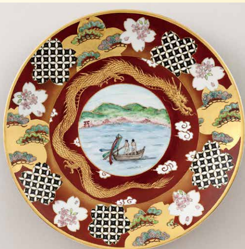
九谷焼上絵付（色絵金欄手）