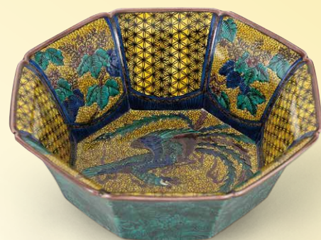
九谷焼上絵付（五彩青手）