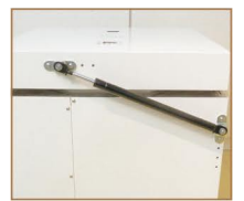
フタの開閉が女性でも片手でラクラク! (油圧ダンパー採用)